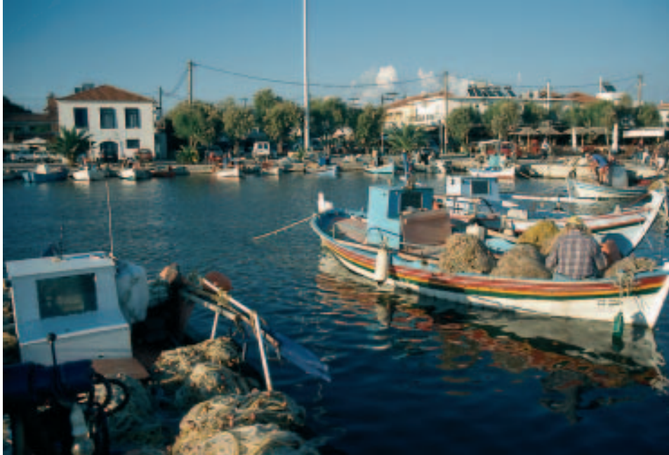
Am Hafen von Skála Kallonís: Der Golf bietet reiche Beute