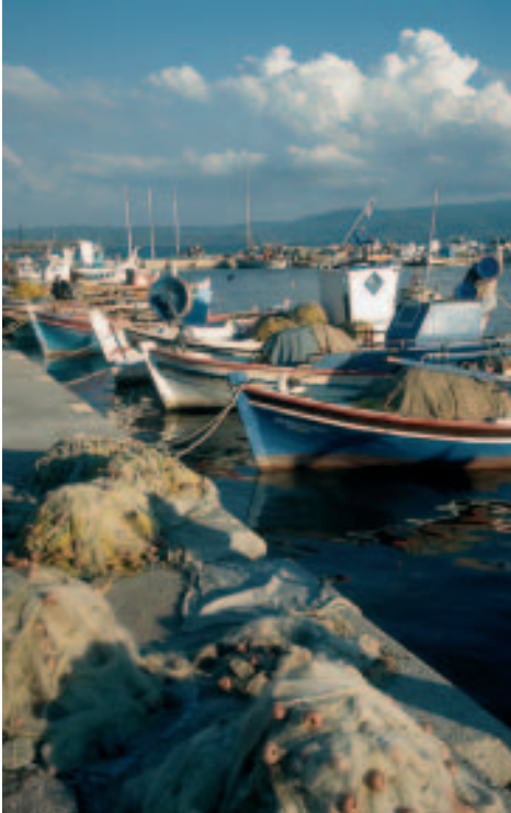
Abendstimmung am Hafen: in Skála Kallonís

► Richtung Parákila und Agra : Die Asphaltstraße, die von Kalloní an der Abzweigung nach Skála Kallonís vorbei und über Parákila und Agra in den südlichen Inselwesten verläuft, führt bis zur Verbindungsstraße Eressós – Skála Eressou und bildet so eine gut befahrbare, verkehrssarme Alternative zur Fahrt auf der Hauptstraße via Ántissa. Näheres im Kapitel zum Westen, Abschnitt „Östlich von Skála Eressou: Die Südroute nach Kalloní“.