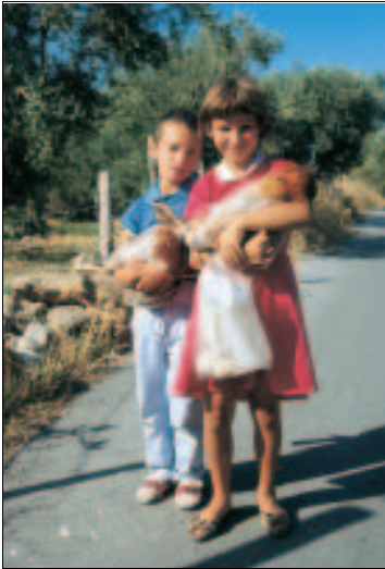
Huhn in Plastik: Begegnung auf der Landstraße

die verschiedenen Heiligen geweiht sind: clever vom Abt, denn auf diese Weise erhöht sich auch die Zahl der Spenden.