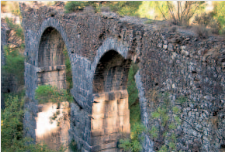
Versteckt: Aquädukt von Lámbou Míli

besser, man geht zu Fuß. Nach etwa 2,5 Kilometern liegt der Aquädukt links unterhalb der Piste. Vorsicht: Der Abstieg auf dem steilen, äußerst rutschigen Hang hinab zum Bauwerk ist gefährlich!