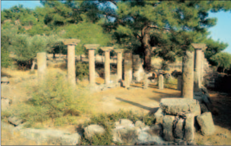
Inmitten friedvoller Olivenhaine: Basilika Chalinádou

außerdem bei Thermí und Mandamádos (siehe jeweils dort). Die genauen Daten der „bull feasts“ wechseln allerdings oft